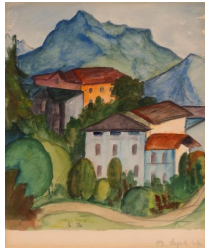
3. Hermann Hesse (Calw 1877 - Montagnola 1962) Veduta di Certenago , 1926 aquarelle sur papier, 25 x 23.5 cm Collection privée