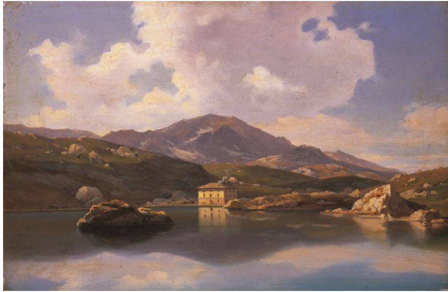
1. Federico Ashton (Milan 1840 – Col du Simplon 1904) Ospizio del passo di San Bernardino , [1870] huile sur panneau, 28.5 x 43 cm Museo Villa dei Cedri, Bellinzona / Donation Athos et Dina Moretti 1987