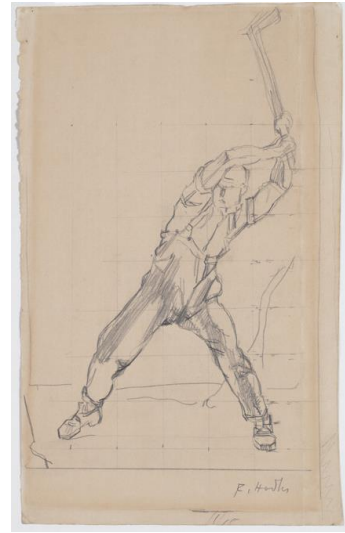
5. Ferdinand Hodler (Berne 1853 - Genève 1918) Spaccalegna , 1910 ca. crayon sur papier, 41.6 x 25.4 cm Museo Villa dei Cedri, Bellinzona / Donation Adolfo Rossi 1972