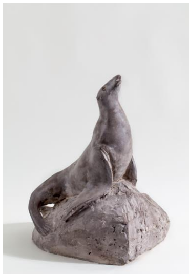
8. Remo Rossi (Locarno 1909 - Berne 1982) Foca , 1945 plâtre patiné, maquette, 66 x 40 x 54 cm Fondazione Remo Rossi, Locarno