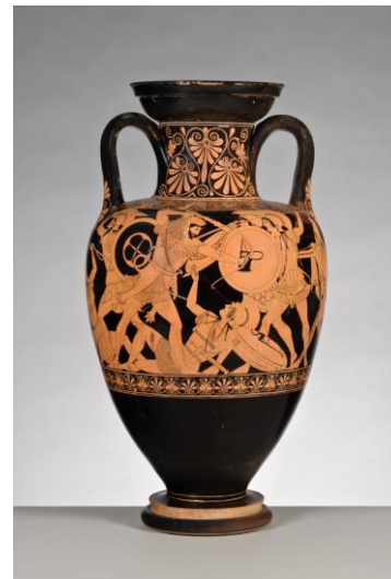
7. Amphore antique attribuée au peintre dit de Berlin, Scène de combat entre Heraclès et les Amazones , 485-480 a.C. céramique, h 55 cm, diam. 30.2 cm Antikenmuseum Basel und Sammlung Ludwig, Bâle