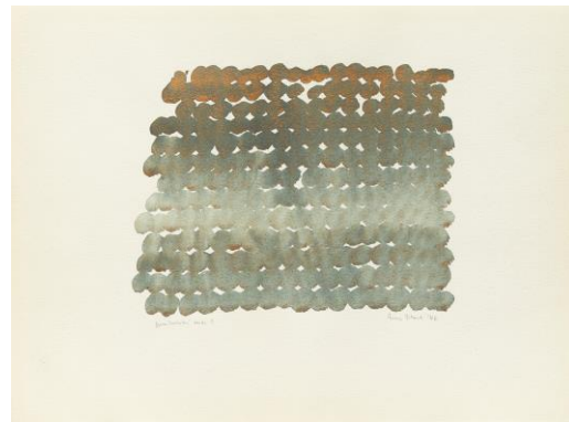
11. Irma Blank (Celle 1934 - Milan 2023) Germinazioni verde 3 , 1982 technique mixte sur papier, 46 x 62 cm Museo Villa dei Cedri, Bellinzona / Acheté avec le soutien de la Fondazione Amici di Villa dei Cedri 2021